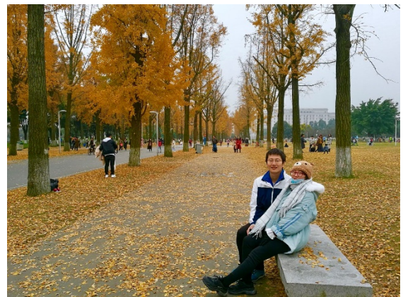
图表7 电子科大清水河银杏

成都市电子科技大学：如果是11月-12月初，电子科大清水河校区或者沙河校区的银杏大道都值得一看。