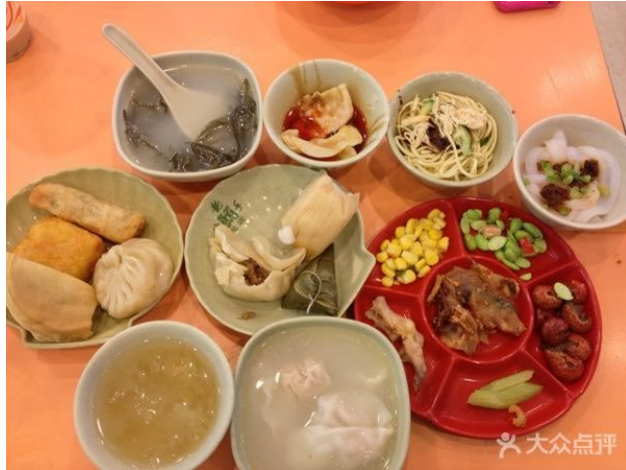
图表8 龙抄手小吃套餐

成都市春熙路：不得不放在靠前位置。毕竟这里才是全菜式。强烈建议龙抄手家的小吃套餐，一份10几样至20几样菜品各一小碟，简直是良心四川小吃集聚。