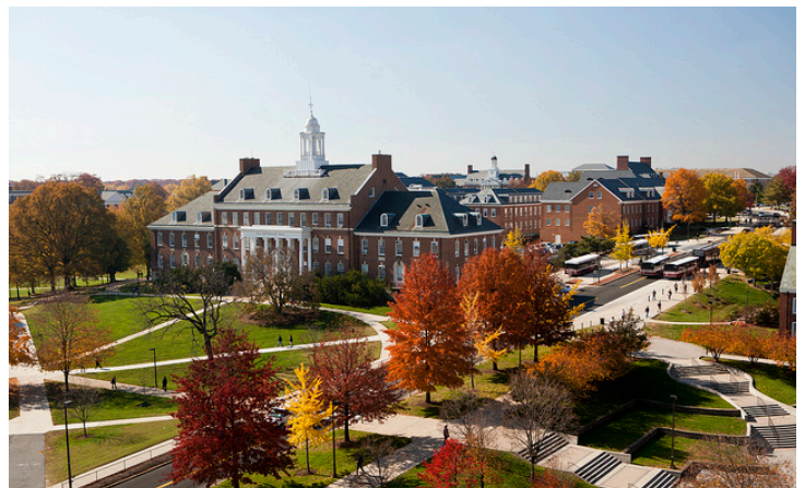
Figure 4 JHU 一角