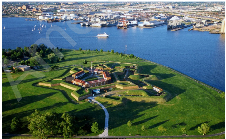
Figure 3 Fort McHenry 空中图