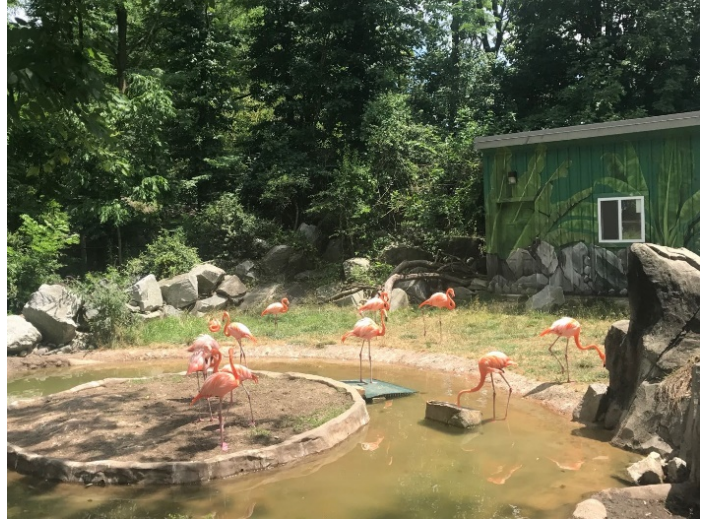
Figure 5 动物园里的火烈鸟 Flamingo