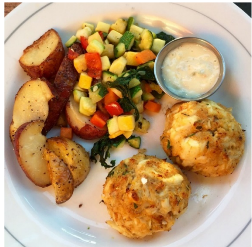
Figure 7 Crab Cake 蟹饼