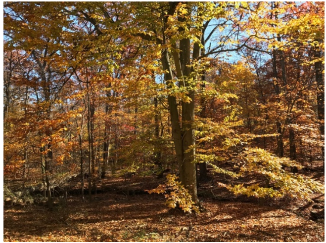
Figure 1 Baltimore 秋季植被