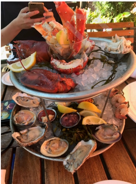
Figure 6 海鲜塔 Seafood tower