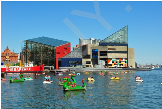
Figure 2 Baltimore 海洋馆外观