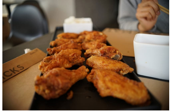
Figure 7 kyochon

7. 韩式炸鸡-最爱三家: bbq chicken LA, kyochon chicken, chicken day 。各有千秋, 三家最爱的炸鸡。