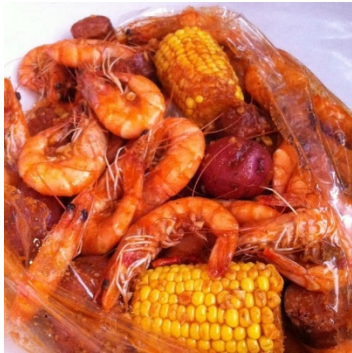
Figure 1 boiling crab

1.boiling crab 的 king crab legs, shrimp, +corn, the whole sha-bang flavor (混合全口味) 偏辣, 建议 mild spicy 记得 to-go 人多的话, 多要一份 lemon, free 的。人很多, 一般需要排队。