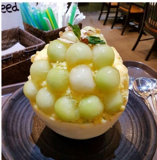
Figure 12 oakobing Melon

12. Oakobing 沙冰，因为喜欢吃水果，所以超喜欢 melon 沙冰。不过奶茶和年糕味道才是这家店的特色。相似款 Sul&beans，因为品类不如 oakobing 的全，列作替代品。但是地理位置便利，毕竟在 H mart 的 plaza。