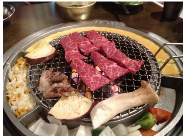
Figure 5 Kang Hodong Baekjeong