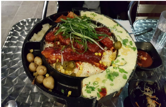
Figure 8 a Mister bossam rib

8. mister bossam 不论是 bossam (菜包肉) 还是 rib 芝士排骨, 都是嗜肉者超爱品。