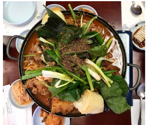
Figure 11 Gam Ja Gol

11. Gam Ja Gol 土豆脊骨汤。量足，肉多，大土豆。上面一层大概是芝麻叶吧。又香又暖。