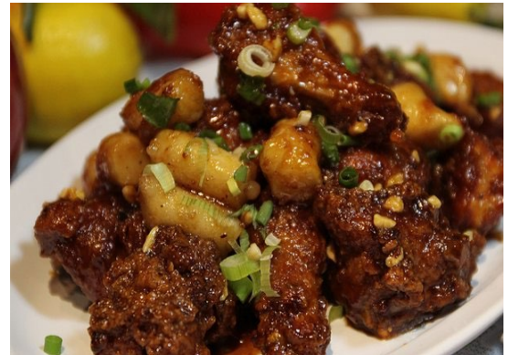
Figure 4 yasiknara

相似款 choe gang jip ，他家猪蹄偏辣，但不会特别辣，而且有 diy 饭团。可惜看到 google 显示 permanent closed，所以把它列到相似里，超爱他家的搭配啊。