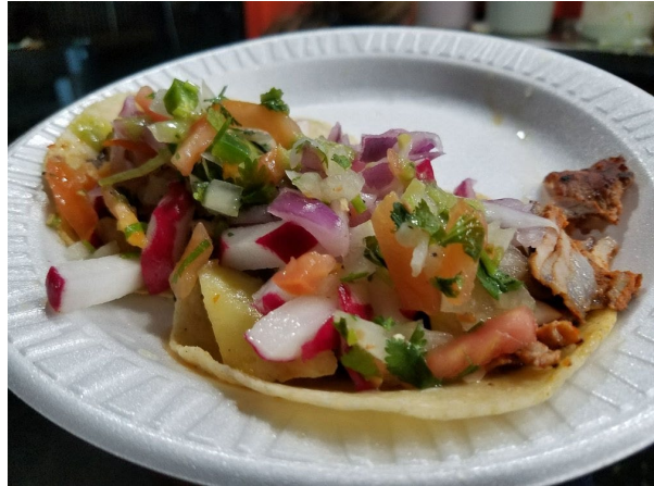
Figure 13 b El flamin Taco

13. El flamin taco 餐车，最喜欢现切下来的 taco。便宜实惠，无限量配料，超好吃洋葱。记得带 cash，1 刀、2 刀一个小 taco，新鲜好味。