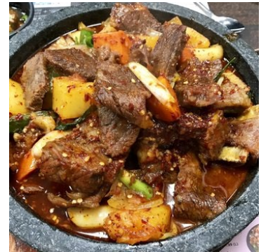
Figure 2 Sun nong dan

2.Sun nong dan 一个华人留学生里超火的 24 小时店。牛尾+牛肉锅, 正常辣度, 建议 mild 或 medium spicy