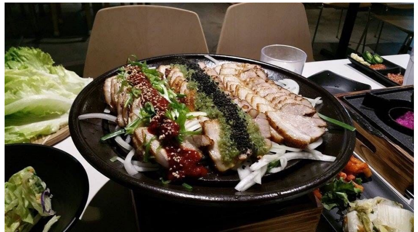
Figure 8 b Mister bossam Bossam

9. EMC seafood & raw bar 的 uni pasta, lobster roll 和特价生蚝。