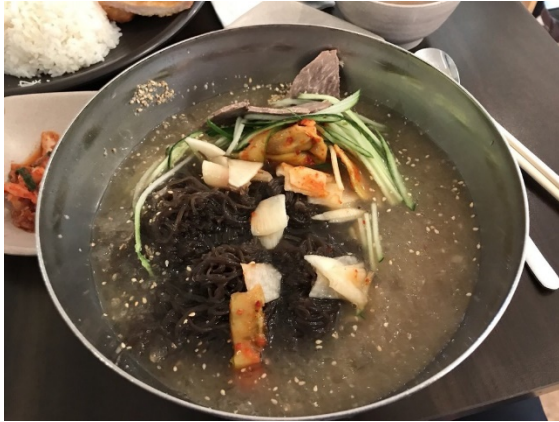
Figure 10 Yuchun

10. Yuchun 的冷面- 韩国传统冷面，虽然我迄今为止吃的最好吃的冷面是家乡朝鲜大妈开的店-从我刚上小学吃到现在，要吃终身，已经有感情了。但是 Yuchun 可以排第二，绝对夏日清凉美好回忆。