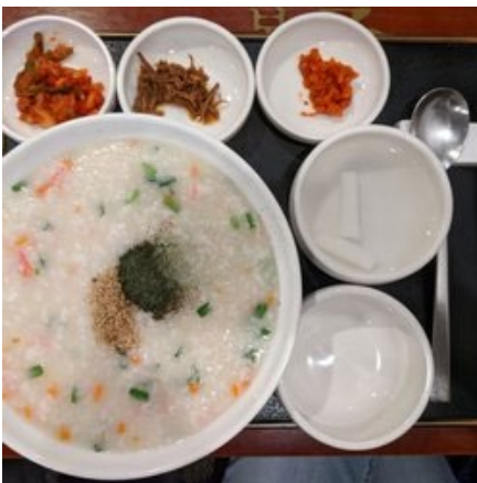
Figure 3 Bonjuk

3. bonjuk 喜欢喝粥的人的福音。大概是韩国开到 LA 的分店吧, 所有粥都好喝。除了鱿鱼和鱼个人不是很喜欢, 也可能和我本身不大喜欢鱿鱼和鱼肉有关。