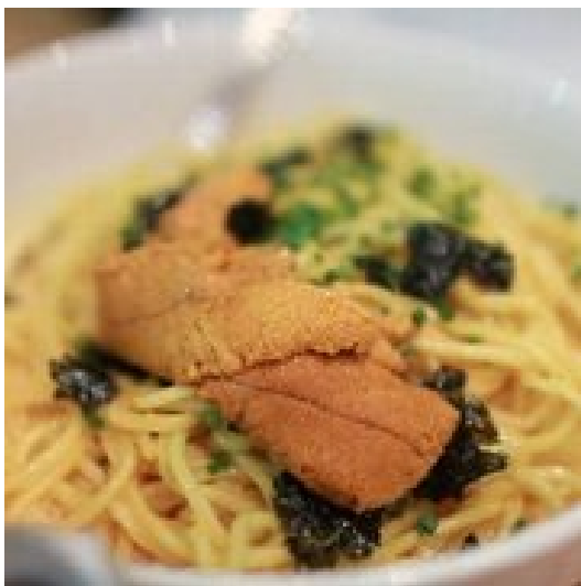
Figure 9 a EMC uni pasta

9. EMC seafood & raw bar 的 uni pasta, lobster roll 和特价生蚝。