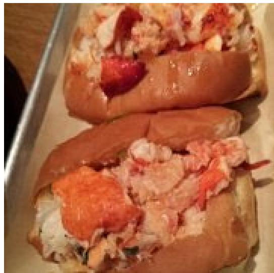
Figure 9 b EMC lobster roll