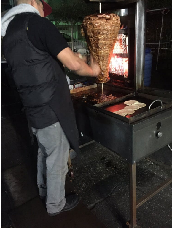
Figure 13 a El flamin 现切肉

13. El flamin taco 餐车，最喜欢现切下来的 taco。便宜实惠，无限量配料，超好吃洋葱。记得带 cash，1 刀、2 刀一个小 taco，新鲜好味。