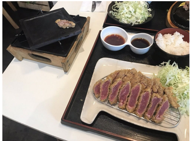
Figure 14 Tokyo hamburg 现烤 katsu

14.tokyo hamburg 不论是现烤的 katsu 还是 hamburg 现烤肉，都超美味。而且自己现烤，又很好玩。大爱的小店。