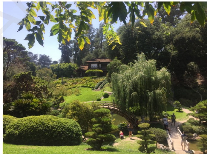
Figure 17 Hungtinton Library 日式园林