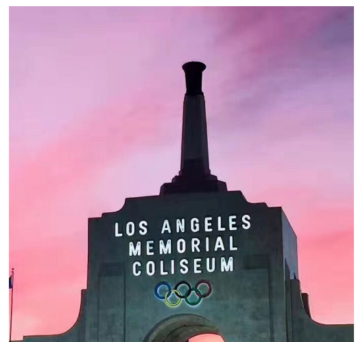
Figure 22 LA 1984 年奥运会场馆