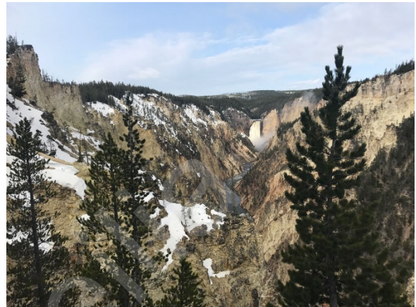
Figure 3 艺术家点