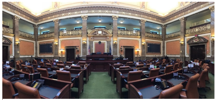
Figure 5 犹他政府议会厅