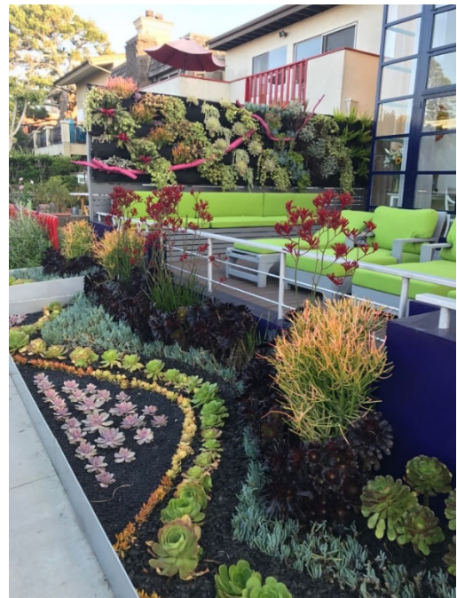
Figure 7 Venice Canal