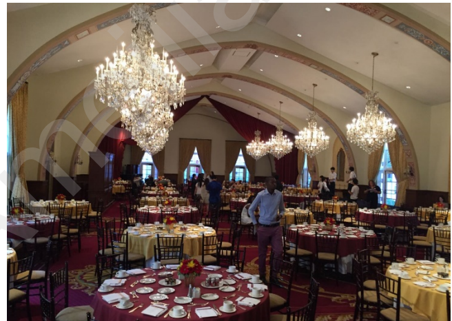
Figure 9 商学院举行餐会的空厅样子