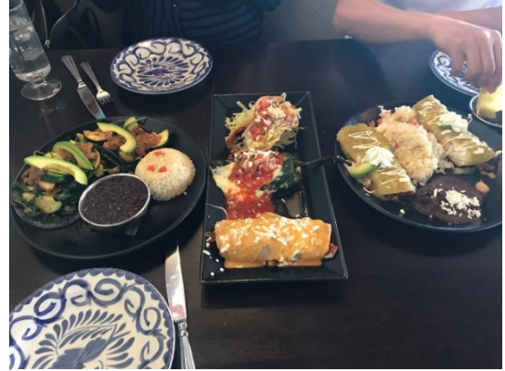
Figure 11 El Torito 的 burrito 和 taco