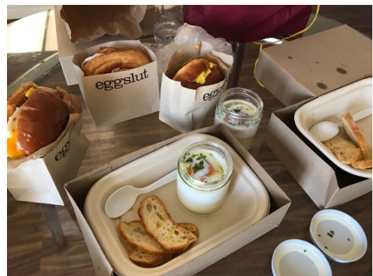
Figure 10 Eggslut