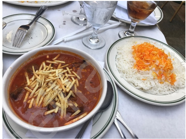
Figure 23 Raffi's Place 中东菜