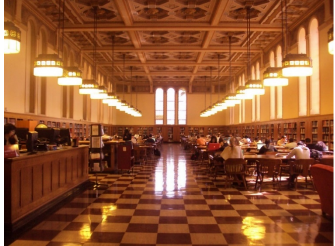
Figure 25 Doheny Library 图书馆