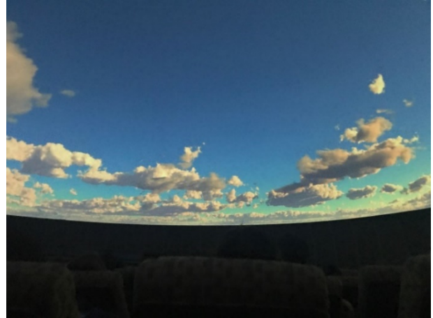
Figure 20 Griffin Observatory 天文球幕初始