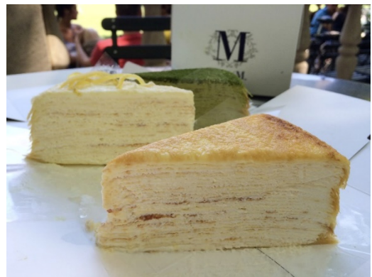
Figure 24 Lady M 的 Mille Crepe slice