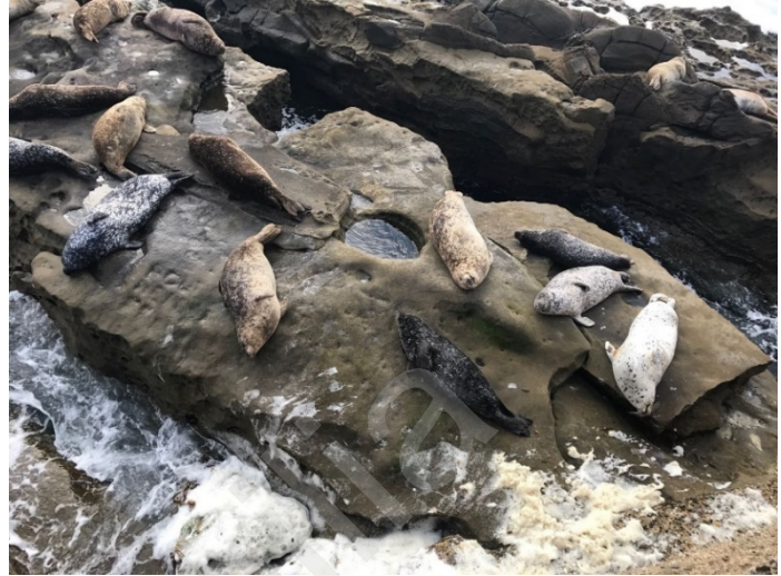
Figure 14 Seal Rock 在礁石上的海豹