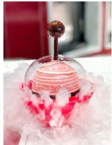
Figure 15 iDessert 冒烟冰激淋