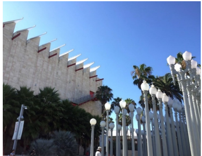
Figure 19 LACMA 网红灯柱