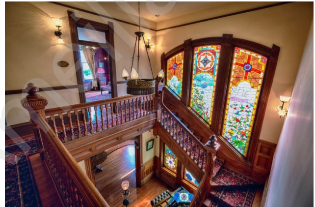
Figure 12 Britt house 走廊