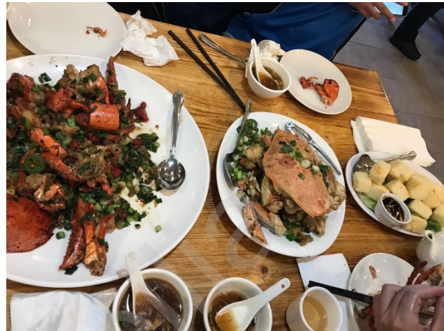
Figure 16 Newport 新港粤菜 炒龙虾