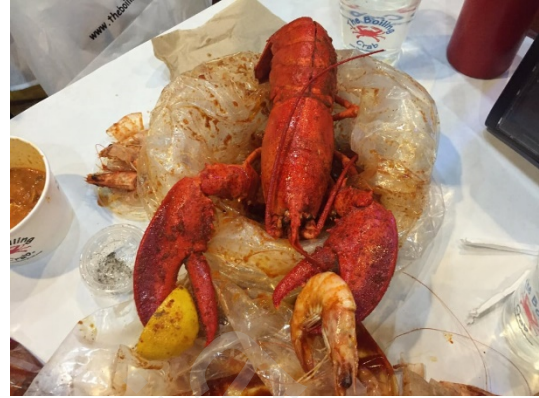
Figure 6 Boiling Crab 龙虾