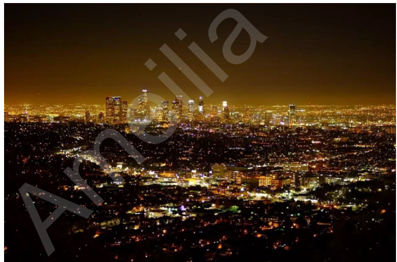
Figure 21 从天文台看 LA 夜景