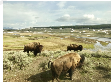
Figure 4 黄石公园耗牛