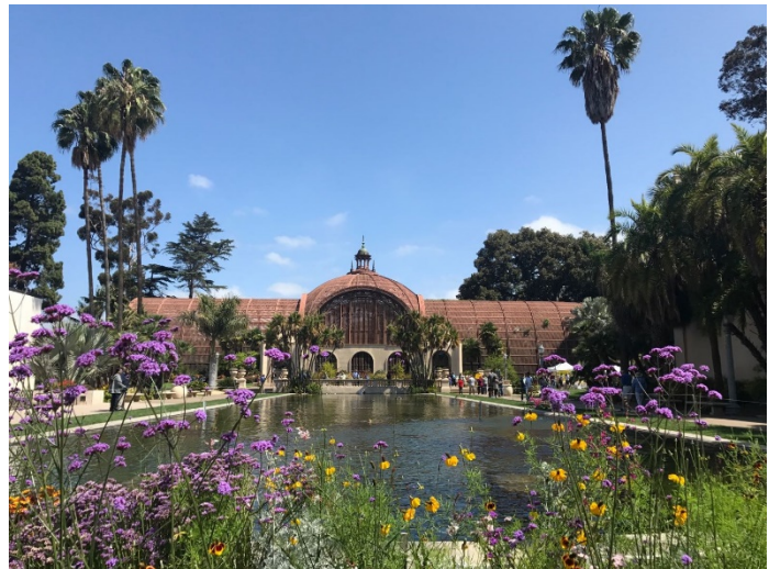
Figure 13 Bolboa park 植物园外