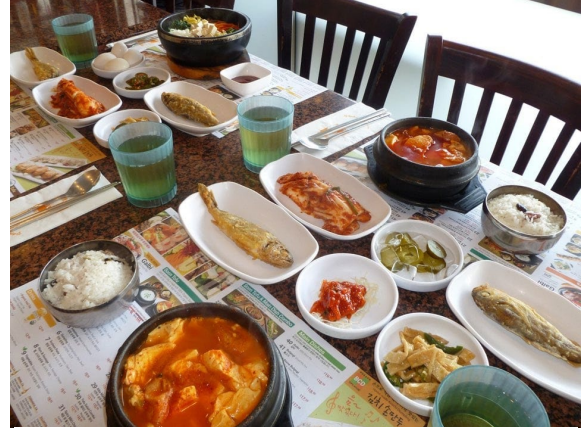
Figure 8 BCD tofu 套餐