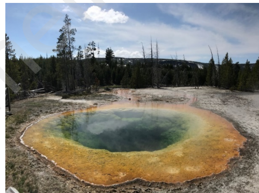
Figure 1 牵牛花池